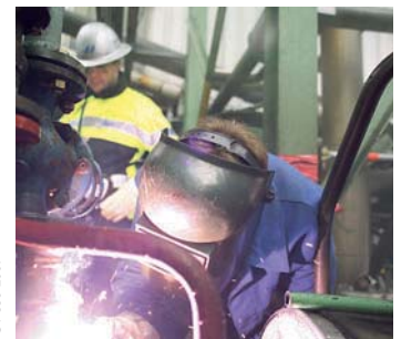
Überwachung von kritischen Aufgaben