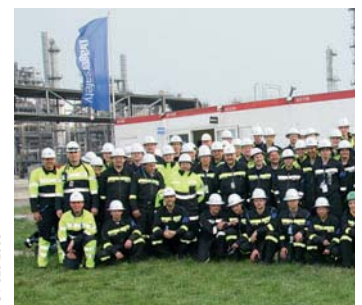
Einsatzkräfte Shutdown Management