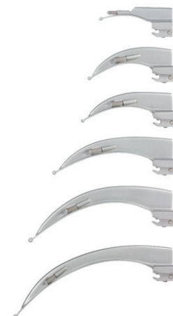
Warmlicht (WL) Laryngoskop-Universalset