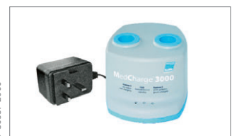
Universal-Ladestationen (MX50028) Netzstecker gemäß DIN 49441/DIN 49441, A2.