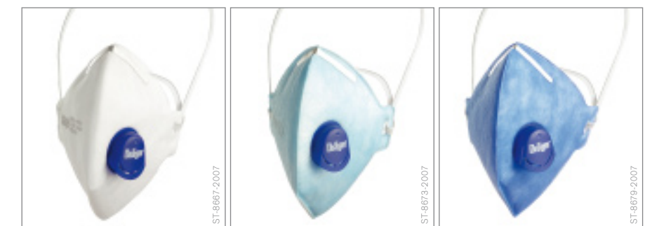
Drei Farben, drei Schutzklassen – für mehr persönliche Sicherheit.

Für partikelfiltrierende Halbmasken gilt die europäische Norm EN 149. Ihre Fassung von 1991 wurde 2001 überarbeitet, als die Zahl der Typklassen FFP („Filtering Face Pieces“; partikelfiltrierende Halbmasken) auf drei reduziert und vereinheitlicht wurde. Eine Maske der Typklasse FFP1 muss dabei eine Filterleistung von mindestens 80 % erreichen, gefolgt von der FFP2 (> 94 %) und FFP3 (> 99 %). Diese Werte bleiben mit der neuen EN 149:2001+A1:2009 unverändert erhalten. Allerdings wurden die zugrunde liegenden Testverfahren erheblich verschärft. Als Testsubstanzen dienen je 120 Milligramm Kochsalzstaub und Paraffinöl. Weitere Parameter für die einzelnen Schutzklassen sind unter anderem Gesamtleckage und Atemwiderstand.