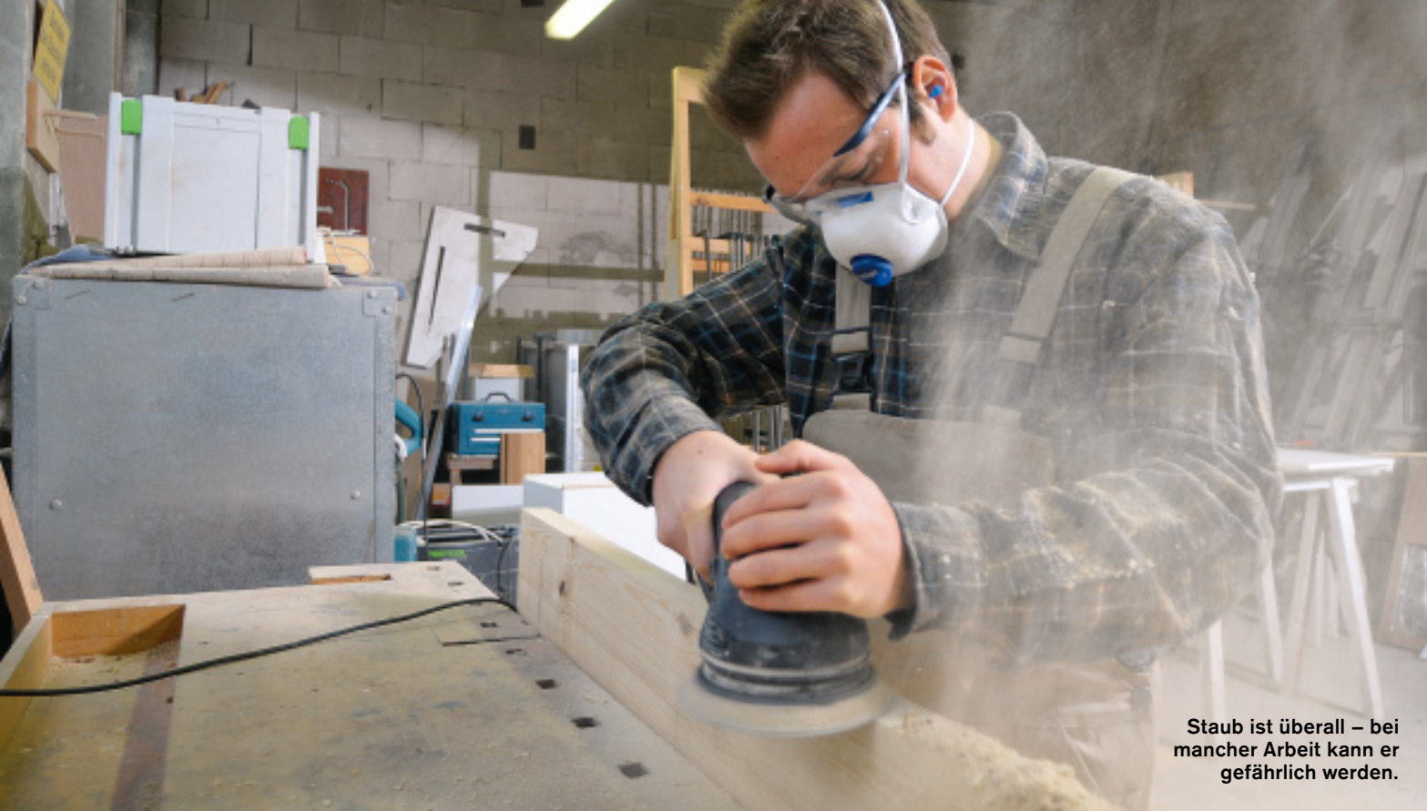
Staub ist überall – bei mancher Arbeit kann er gefährlich werden.